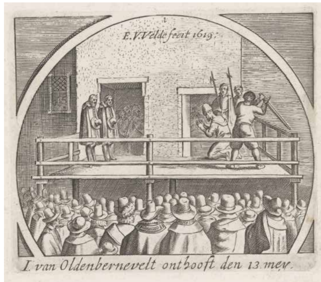
De onthoofding van Johan van Oldenbarnevelt vond plaats voor het ogen van duizenden mensen. Esaias van de Velde verbeeldde het tafereel van dichterbij.

woorden: ‘Mannen, geloof niet dat ick een landverraeder ben, ick hebbe oprecht ende vroom gehandelt, als een goet patriot, ende die sal ick sterven.’ Vervolgens vroeg hij zijn knecht om zijn violetkleurige slaapmuts, die deze hem op het hoofd zette. Zelf trok hij die met van ouderdom bevende handen over zijn ogen nadat hij naar de zandhoop was gelopen, midden op het schavot.