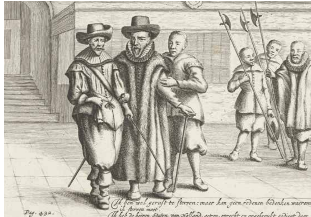
Van Oldenbarnevelt wordt naar het schavot geleid, door Hendrik Bary. (Rijksmuseum, Amsterdam)

Van Oldenbarnevelt vatte moed en sprak tot de toeschouwers zijn beroemde